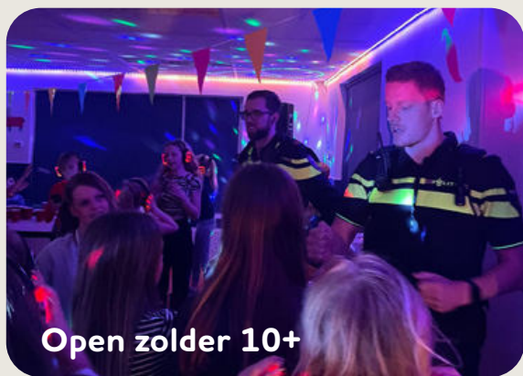
Open zolder 10+

Elke eerste donderdag van de maand is er een open zolder voor de jeugd in de 10+ leeftijd in de gemeente Staphorst. Dit vindt plaats op de zolder van de bibliotheek Staphorst (Venneland 1) van 19.00 tot 21.30 uur. Jongeren kunnen hier spelletjes doen, darten, pingpongen, gamen, chillen, Virtual Reality, tafelvoetbal en meer. Dit is altijd inclusief wat te drinken en eten. Vanaf de zomer begonnen we met drie kinderen per keer. Maar dit is al snel uitgegroeid naar minimaal veertig kinderen per avond. We zijn ondertussen van een keer per maand naar twee keer in de maand gegaan. Het gaat zo goed dat we nu op zoek zijn naar een nieuwe, grotere locatie.